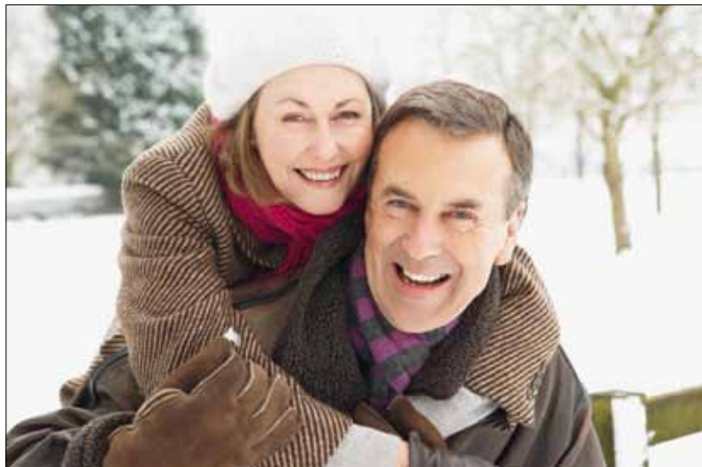
Mit einer guten Vorsorgeplanung bleibt das Leben auch nach der Erwerbsaufgabe finanziell gesichert.

Finanz Forum Im November stand auch das 11. Solothurner Finanz Forum ganz im Zeichen der Vorsorge und Renten. Die Aktualität des Themas zeigte sich in den Besucherzahlen: Gesamthaft konnten in Grenchen und Solothurn mehr als 1200 Gäste begrüsst werden.