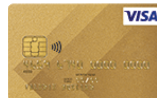
VISA Card Gold