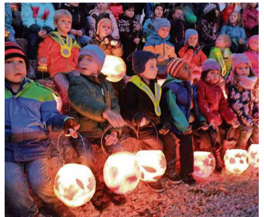
Die Langendörfer Kinder mit ihren liebevoll gebastelten Laternen.

Angeführt von den Lehrpersonen und den Spielgruppenleiterinnen bewegen sich die rund 200 Kinder in verschiedenen Umzügen und auf verschiedene Routen durch das Dorf. Für einmal erleuchteten die Kerzen in den liebevoll geschnitzten «Räben» und selber gebastelten Laternen die Strassen. Der wolkenlose Sternenhimmel und der laue Spätherbstabend sorgten atmosphärisch für eine wunderbare Stimmung. An verschiedenen Stellen formierten sich die einzelnen Umzüge immer wieder zum Singen der einstündigen Lieder. Zum Ausklang genossen die Kleinen die vom Familienverein offerierten Wienerli, Brot und Tee.